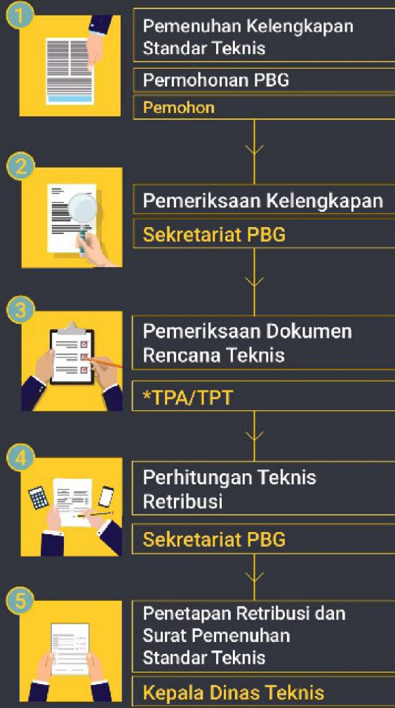
DIAGRAM ALUR PERMOHONAN PBG DAN SLF

Sertifikat Laik Fungsi adalah pernyataan atas kelaikan fungsi sebuah bangunan yang telah selesai dibangun.